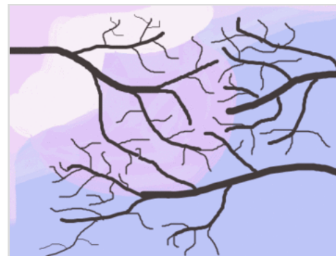
Animación ejemplar del cerezo en flor .

Por esta razón aparecieron alternativas libre de regalías como el PNG con mayores calidad de imagen y mejores ratios de compresión.